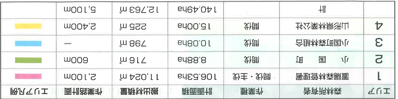
表-1 美施主体別森林整備計画 (平成24年~平成26年)