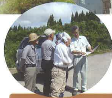
舟形町（後山・後山式）公社造林地 昭和 53 ～平成 2 年植栽 38.90ha