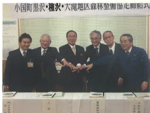
平成24年3月置賜森林管理署にて協定締結式

今後とも、低コストと高率的な作業システムの構築に向け民有林、国有林が協力しながら、地域における林業の振興、山村の活性化に取り組んで参りたいと考えております。